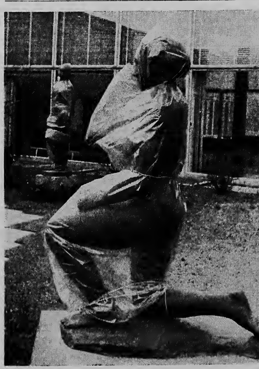
Esaqui ta un bista stranjo berdad, pero e ta alavez un dje mehor medidanan contra roet, stof y shinishi cu ta bini di industrianan. E invento nobo aqui a ser pensa y aplica na Folkwang museo na Essen. Dje manera aqui nos ta mira e bustonan den tempo di friu.